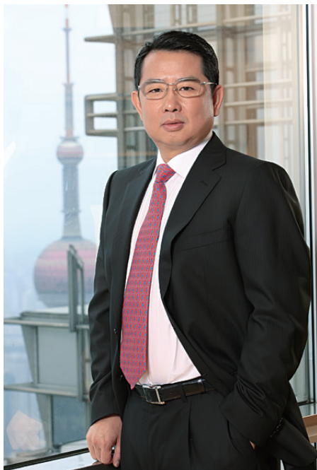
宏信建設發展有限公司 董事會主席及非執行董事