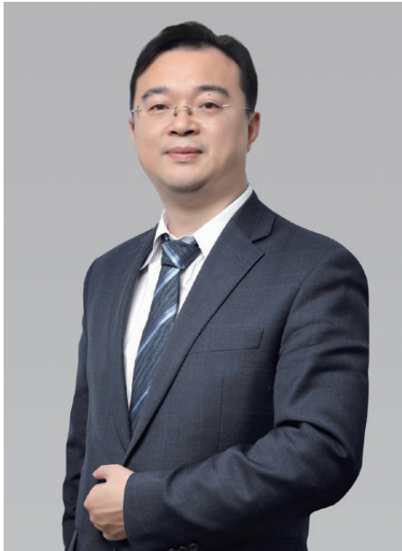
宏信建設發展有限公司 執行董事及首席執行官